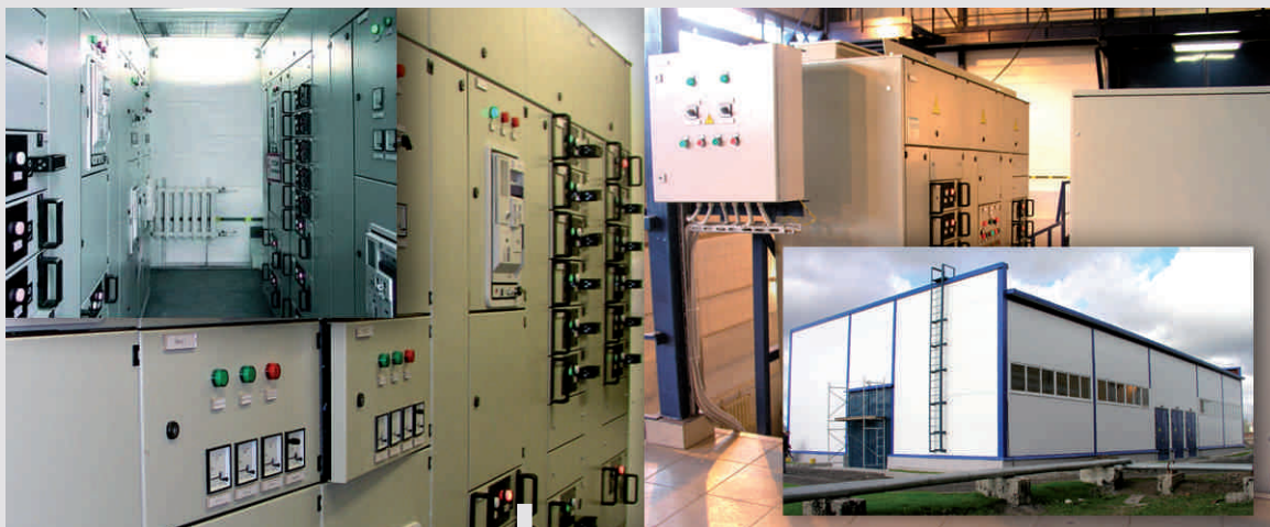
Водоканал Санкт-Петербурга Станция Водоснабжения Московский район Санкт-Петербург (Россия)