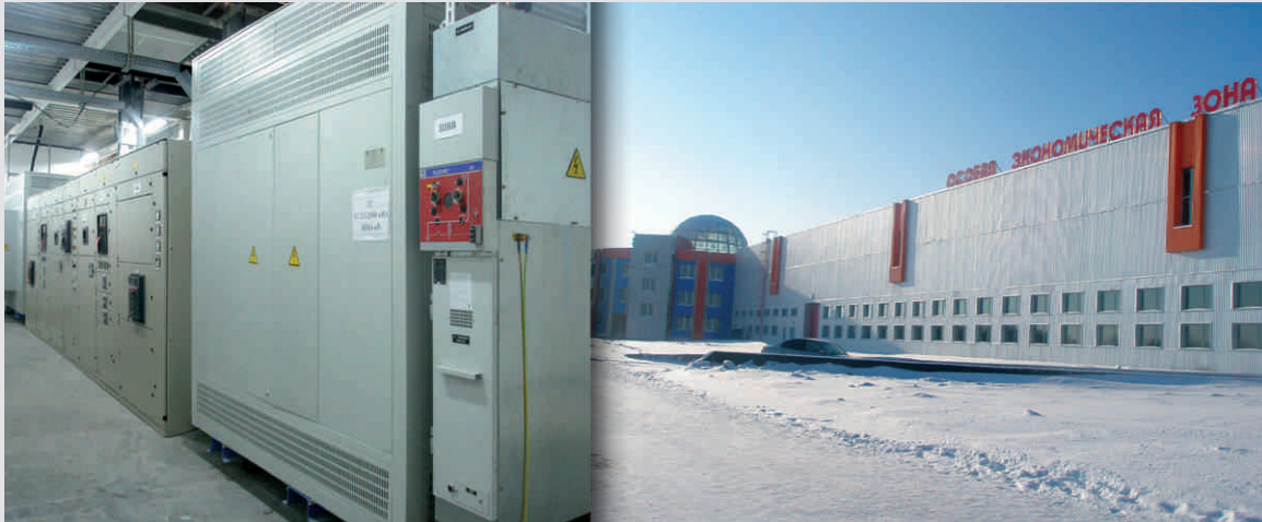
Завод Северстальавто Елабуга (Россия)