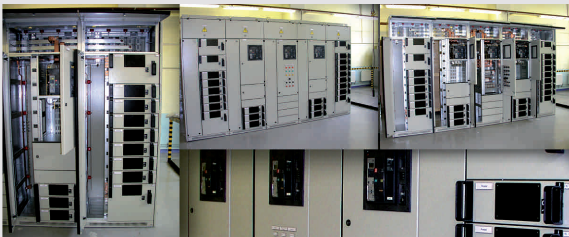
ОАО Акрон Великий Новгород (Россия)