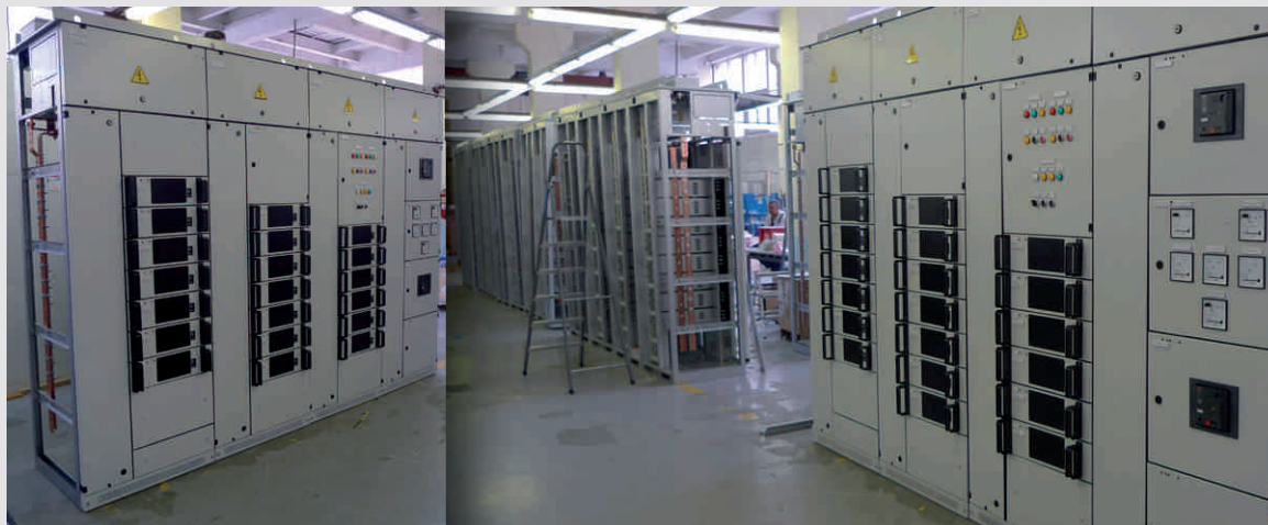
Танеко Нижнекамский НПЗ Татарстан (Россия)