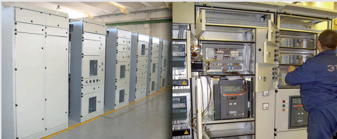
АО Сода Стерлитамак Башкортостан (Россия)