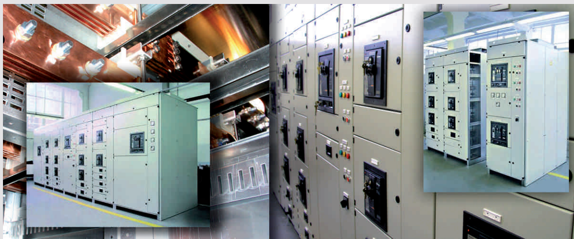
Торгово-развлекательный Центр «Хорус Капитал» Москва (Россия)