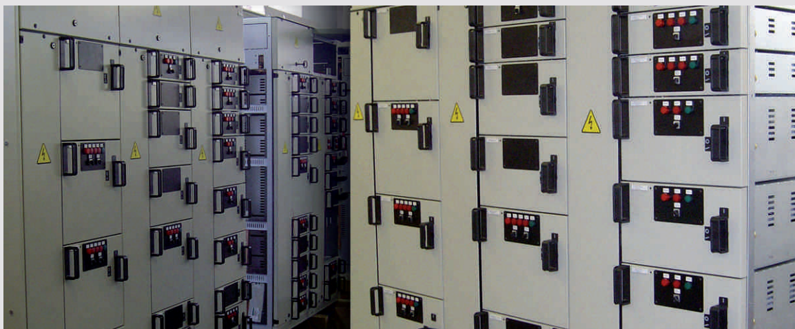
УралТеп ЗАО УралТеп Новосвердловская ТЭЦ Екатеринбург