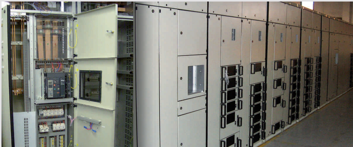
АО Мосэнерго ТЭЦ 9 Москва (Россия)